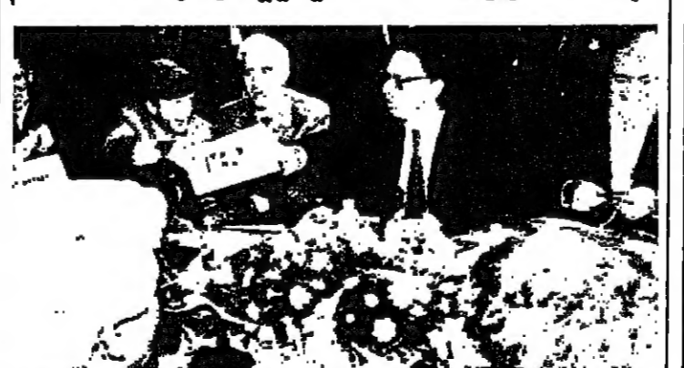
اجتماع الوزراء الثلاثة مع المسؤولين الاسرائيليين

اتهم وزير الخارجية الاسرائيلي اسحق مورايي المجموعة الأوروبية امس باستغلال الاقتصاد سلاح سياسي بينما وصل ثلاثة من وزراء خارجية دول المجموعة الأوروبية الى اسرائيل ليبحث سياساتها تجاه عملية السلام. وقال مورايي ستترك المحادثات على روابط اسرائيل الاقتصادية مع المجموعة الأوروبية في ضوء القيود الاقتصادية والسياسية المفروضة على اسرائيل. وتهدف زيارة وزراء خارجية ايطاليا